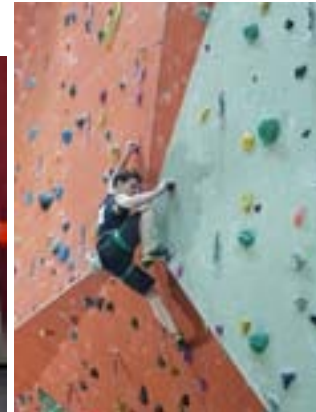
LM Lead Perchtoldsdorf 2017