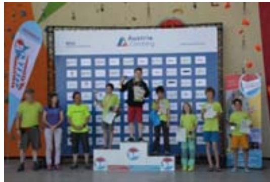
Österreichische Staatsmeisterschaften Lead 2017