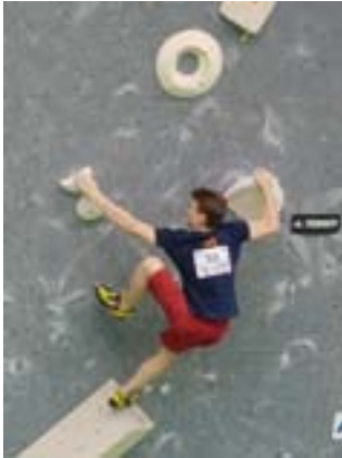
LM Bouldern 2017